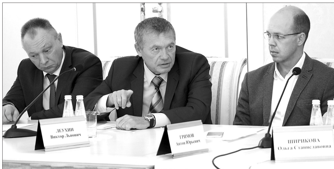
Руководители оппозиционных фракций обсуждают на Госсвете проект областного бюджета.

— сконцентрировать средства на решение важнейших социально-экономических задач: увеличить финансирование здравоохранения, культуры, образования, социальную поддержку граждан т.д.