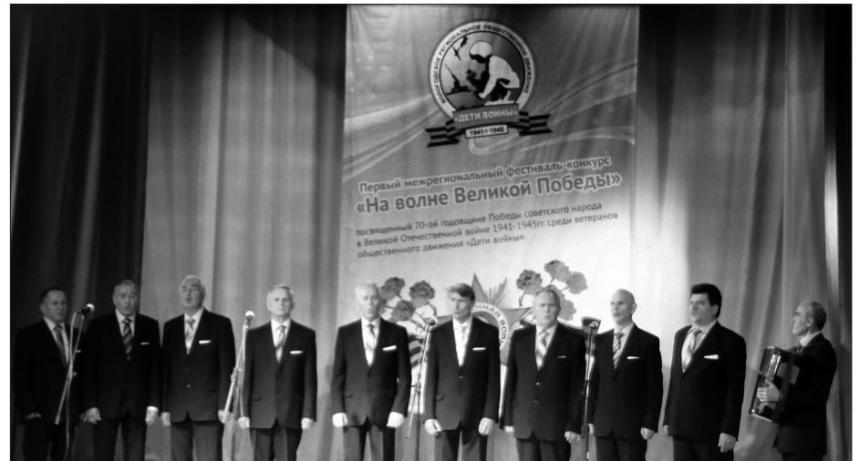
«Этот день Победы порохом пропах...»