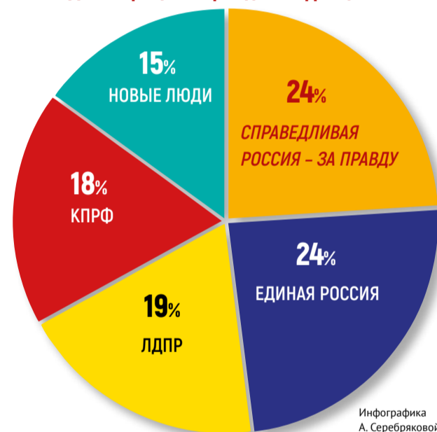
Доля обращений граждан по фракциям

О том, что люди действительно доверяют партии социалистов, говорит, прежде всего, количество обращений. По статистике сайта Государственной Думы, несмотря на то, что фракция СПРАВЕДЛИВАЯ РОССИЯ – ЗА ПРАВДУ меньше фракции ЕР в 11 раз, обращений к депутатам партии поступает столько же.