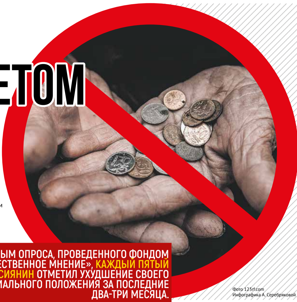
Инфографика А. Серебряковой

43,6 ТЫСЯЧИ РУБЛЕЙ – СТОЛЬКО СОСТАВЛЯЕТ РЕАЛЬНЫЙ ПРОЖИТОЧНЫЙ МИНИМУМ, РАССЧИТАННЫЙ ЭКСПЕРТАМИ ПАРТИИ СПРАВЕДЛИВАЯ РОССИЯ – ЗА ПРАВДУ НА ОСНОВЕ СТОИМОСТИ ПОТРЕБИТЕЛЬСКОЙ КОРЗИНЫ ПО ЦЕНАМ НА КОНЕЦ 2023 ГОДА.